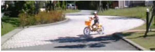
湾曲した道路にピンコロ舗装

フォレストヒルズ牟礼以降の開発地では、いろんな調整とコストダウンをし、価格が高くなるように努力しました。それでも、一般の住宅地より高くなるのは避けられず、その分だけ販売に苦勞しております。