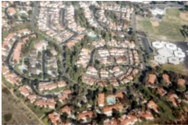
空から見たオレゴン州ポートランドの住宅地

住宅地道路のやわらかいカーブは、街並みの美観を高め、車のスピードを抑えるので安全性を高めるため、欧米では一般的に行われている方法です。ところが日本の役所では、どうしても直線を挟まなければ設計を認めてくれません。そういう法律があるようです。ですから、ゆったりとしたカーブの道路を造らせてくれません。この考え方は車の専用道路に対するものだと思います。住宅地の中の道路は、生活の場、遊びの場、コミュニケーションの場として捉えるべきです。ただ、車が入れないと不便だから入れるようにしているという考え方が良いのではないのでしょうか。車専用道とコミュニティ道路を同じ法律で規制するのは無理があり、不合理だと思います。最近スーパーの駐車場で見られますが、バンプという凸部を路面に設けることもあります。韓国のソウルに行った時、街中の裏路地にバンプがあったのに驚きました。