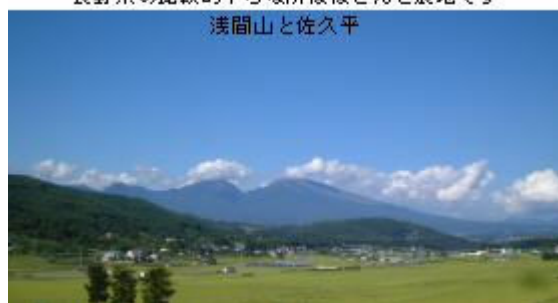
長野県の比較的平らな所はほとんど農地です 浅間山と佐久平

一箇所開発するのに、少なくとも10人、多ければ20人以上の隣接者がいます。中には無条件で反対という方もいます。足元をみて、法外な地代を要求してくる人もいます。そこを何とかお願いして同意を頂き申請しますが、その審議に又長い時間がかかるのです。場所を定めてから、開発許可をもらうまでに2年がかかりました。