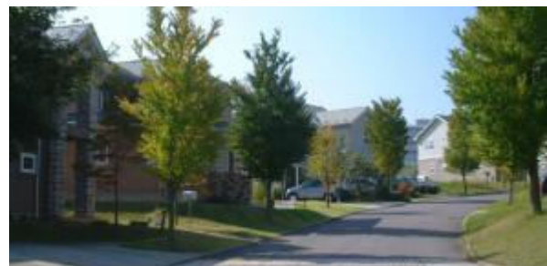
フォレストヒルズ平井 電線がないと街並みが美しい

当社の最初の開発地「フォレストヒルズ牟礼」を計画している時の話です。電柱の地中化をやりたいと電力会社に申し込みました。しかし、一向に採り合ってくれません。悩んだ私は、電力会社の社長以下全取締役に書き留め郵便で抗議文を送りました。そうしたら、県内の幹部が5人ほど駆けつけて来ました。