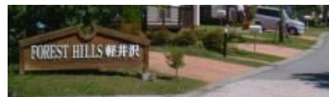
入口のサインと天然ピンコロ舗装

平成4年秋に、「フォレストヒルズ牟礼」を売出すにあたり、「まちづくり」を理解して頂くには実際にキレイな街並みを造って見てもらわなければダメだろうと考え、建売を5棟造りました。当時かなりマスコミの話題になりました。